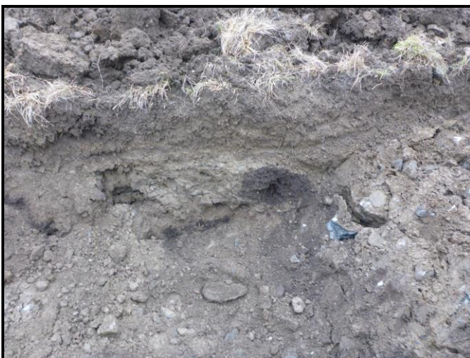
Fig. 2. Djupschaktat parti i schakt 9, där det framkom fyllnadsmassor och omrörda jordlager under ett ca 0,5 meter tjock matjordslager. De omrörda lagren fortsatte till minst 1,2 meters djup, botten av gropen. Det djupschaktade partiet illustrerar karaktären inom stora delar av utredningsområdet.